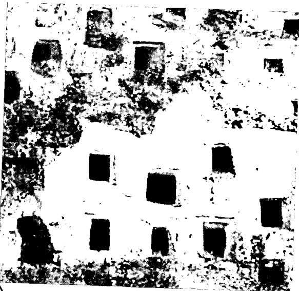
Sopra, tombe a forno di Pantalica.