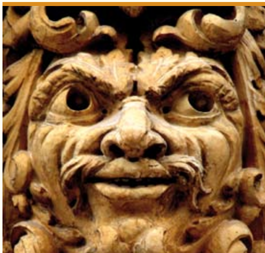
Un particolare del balcone dei fanciulli

saloni uno giallo, uno in verde, e uno in rosso, che prendevano il nome dal colore della tappezzeria dei sofà, era dotato di sala della musica, del the, del gioco e del fumo. Il superbo salone delle feste, dalla volta affrescata con scene mitologiche, e dalle pareti con le raffigurazioni delle passioni e le distra-