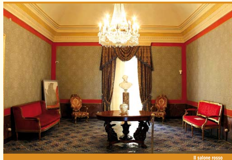
Il salone rosso

"È in noi che i paesaggi hanno paesaggio. Perciò se li immagino li creo: se li creo esistono; se esistono li vedo come vedo gli altri. A che scopo viaggiare? ... I viaggi sono i viaggiatori. Ciò che vediamo non è ciò che vediamo, ma ciò che siamo".