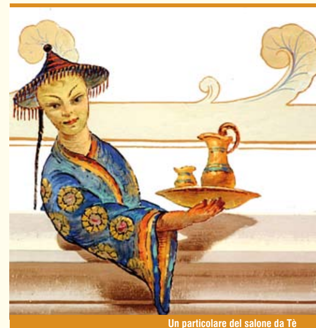
Un particolare del salone da Tè

Nel progetto del palazzo Nicolaci il coinvolgimento del Sortino sembra certo, visti gli stretti legami con il principe Giacomo, ma anche di altri architetti come il Labisi, Sinatra e numerosi intellettuali locali e stranieri che frequentavano la residenza in cui si respirava l'atmosfera dei Viceré spagnoli e degli ultimi Gattopardi. Quindi il palazzo di Villadorata a Noto è paragonabile al palazzo Biscari di Catania, al Beneventano a Siracusa e al castello di Donna Fugata a Ragusa, per la ricchezza di particolari di facciata e la qualità degli interni affrescati e finemente arredati con tendaggi e mobili provenienti dalle principali città europee. Distribuito su novanta vani con tre